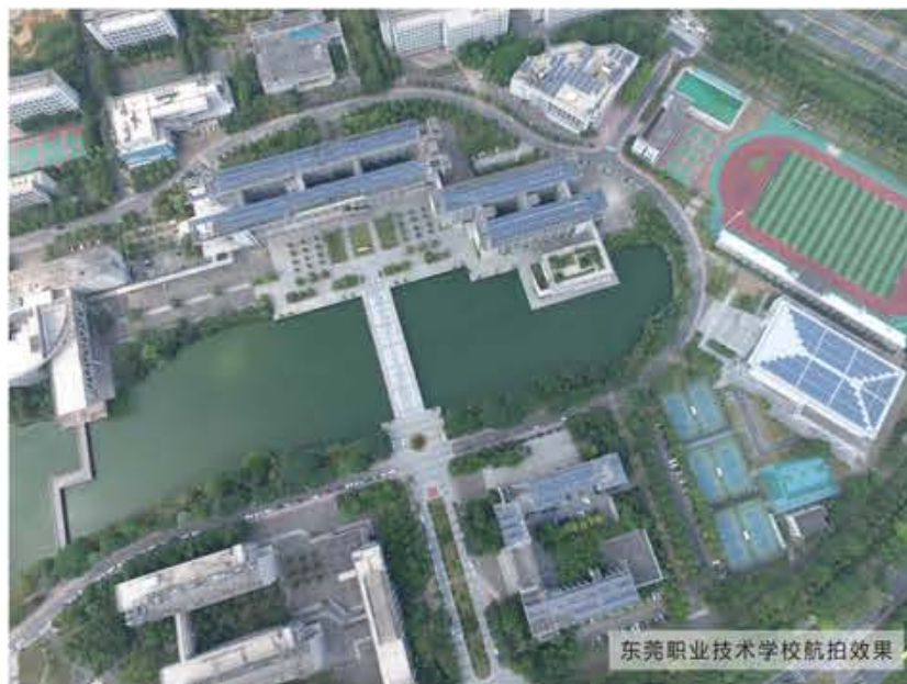
东莞职业技术学院航拍效果