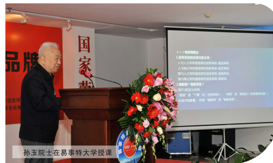
孙玉院士在易事特大学授课

以客户为中心,以奋斗者为本;以质量为生命,以交付为目标。易事特充电桩以创新技术、严控质量为每一次交付代言,本次荣获“充电设施质量信得过制造商”荣誉,既是荣誉,更是激励。接下来,在新能源车及充电桩推广应用的硬性指标下,我们深知肩负更大责任,易事特充电桩将聚焦“智能快充、绿色服务和绿色制造”,为充电行业的进步、为新能源智慧城市、智慧交通生态网络的建设贡献力量。