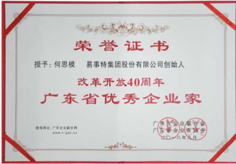
改革开放40周年广东省优秀企业家