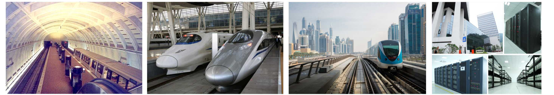
美国首条无人驾驶地铁（夏威夷） 武广高铁 北京地铁 深圳地铁轨道交通网络运营控制中心

作为智慧交通行业优秀企业，30年来，易事特一直在轨道交通供电系统解决方案深耕细作。易事特服务于高铁、地铁、高速公路、州际快线、机场等交通领域，先后为美国首条无人驾驶地铁（夏威夷）、全国首条中低速磁浮列车、武广高铁、北京地铁、上海地铁、深圳地铁（11号线）、宁波地铁、东莞地铁、杭州萧山国际机场、白云国际机场等单位提供永续电力。