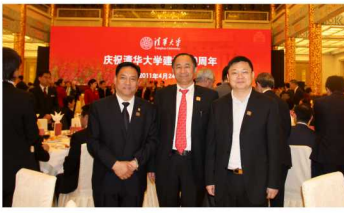
清华大学百年校庆杰出校友

何思模，易事特集团股份有限公司（股票代码：300376）创始人，产业经济学博士，教授。1965年出生，安徽安庆人，1981年入伍，1986年清华大学研究生，现任董事局主席、易事特大学校长；民建中央企业委员会副主任、新技术产业和制造业专委会主任；东莞市政协常委；中国电源学会常务理事；合肥工业大学、暨南大学、扬州大学等高校客座教授。 1989年扬州创业，在他的带领下，易事特围绕智慧城市&大数据、智慧能源（含储能系统、智能微电网、充电桩、云计算、逆变器）及轨道交通（含监控、通信、供电）等战略新兴产业，为全球用户提供优质IDC数据中心、云计算系统、光储充一体化智慧能源系统、轨道交通智能供电系统等全方位解决方案，致力于成为全球智慧城市和智慧能源系统解决方案卓越供应商。集团在深圳、南京、合肥、昆山设有研发制造基地，拥有全资或控股子公司近80家，在全球设立268个服务网点，产品远销全球100多个国家和地区。 何思模身为优秀上市集团领航人，在事业取得辉煌成就的同时，还积极回馈社会，先后投入数千万元支持社会公益慈善事业。荣获了“改革开放40周年广东省优秀企业家”、“全国政协公益慈善之星”、“民建中央全国社会服务工作先进个人”、“民建中央全国抗震救灾优秀会员”、首届“广东创业之星”、“广东省劳模”、“中国民营企业十大杰出管理人物”、“中国最具社会责任企业家”等社会重要荣誉。