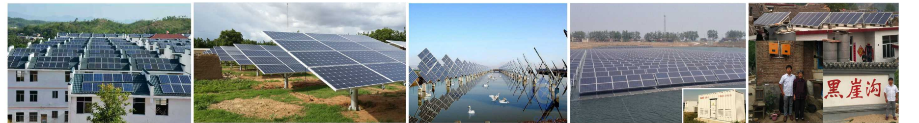
江西扶贫光伏项目 非洲马里共和国光伏电站 山东曹县渔光互补光伏电站 亚洲最大水面光伏电站 习总书记的扶贫点河北保定黑崖沟光伏扶贫

易事特自主研发的光伏产品相继获得CQC、CNAS、IAF、UL、TüV、ISC等众多国内外权威机构认证，先后服务于新疆、宁夏、甘肃、内蒙古、青海、河北、江苏、山西等30多个省市及德国、英国、印度、沙特阿拉伯等100多个国家及地区，建成老挝分布光伏发电项目、危地马拉光伏发电项目、印度离岛发电站项目、亚洲最大水面光伏电站、陕西神木光伏农业大棚（牡丹种植）、山东曹县农光互补项目、青海格尔木光伏电站、宁夏中卫地面光伏电站，以及在重庆、广东、江西、山东、广西、湖南、陕西、河北、贵州、福建等多个省市光伏扶贫等众多典型项目，为国家节能减排作出积极贡献。