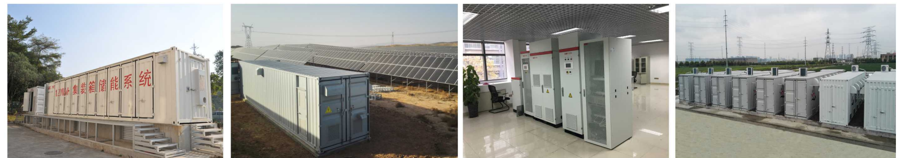
易事特厂区250kW/1.2MWh储能电站 宁夏光伏电站增储6MW/14.4MWh储能电站 安徽合肥光储微电网示范平台 江苏昆山3MW/22.5MWh储能电站

微电网不仅可以解决分布式能源发电系统的大规模的接入问题，还为用户带来了其他方面的效益，成为大电网的有益的补充。由于这潜在优势，作为未来可能的一种能源供应模式，微电网正得到了越来越多的重视。我司已在安徽、北京、浙江、江苏、广东、湖南、福建等地区已广泛使用。