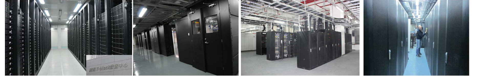
腾讯T-block数据中心(中国移动最先进的数据中心) 中国电信北京云计算数据中心 约旦通信大数据中心

作为智慧城市、大数据优秀企业，30年来，易事特一直在电源和数据中心领域深耕细作。先后为腾讯大数据中心、百度大数据中心、中国移动大数据中心、中国电信云计算数据中心、约旦通信大数据中心、工商银行安徽分行大数据中心、河源政府数据中心等单位提供永续电力。