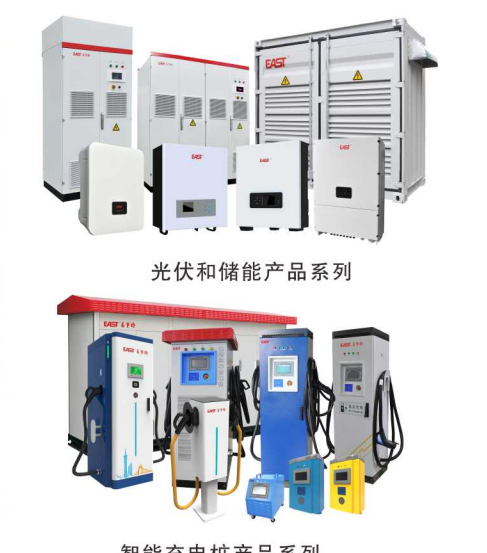
智能充电桩产品系列

核心价值观: 国家 荣誉 诚信 创新 企业愿景: 百年企业 百年品牌 经营理念: 科技成就梦想 执着铸就辉煌 发展战略: 智慧城市&大数据和智慧能源解决方案卓越供应商 阳明心学精髓: 知行合一 从心出发